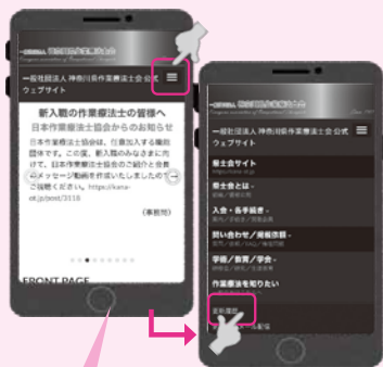
図) 【更新履歴】(スマホVer.)

右上の≡マークをタップ! 「更新履歴」をタップすることで過去の掲載情報を確認できる!